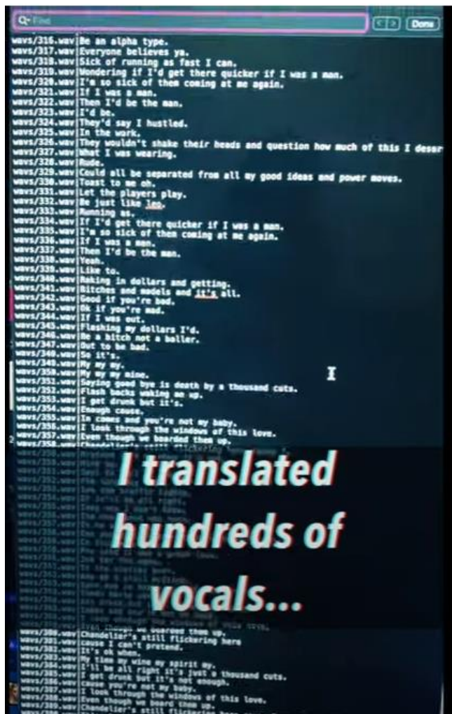
Figure 1 – Formation d'un modèle vocal

13. Ils sont souvent accompagnés de didacticiels complets et détaillés sur la manière d'utiliser ces modèles pour générer de nouvelles œuvres dérivées. Observez comment chaque ligne de la chanson a été divisée en fichiers sonores individuels afin de faire correspondre le son à des mots spécifiques.