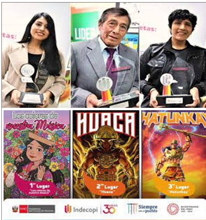
Les lauréats des trois principaux prix et leurs œuvres respectives