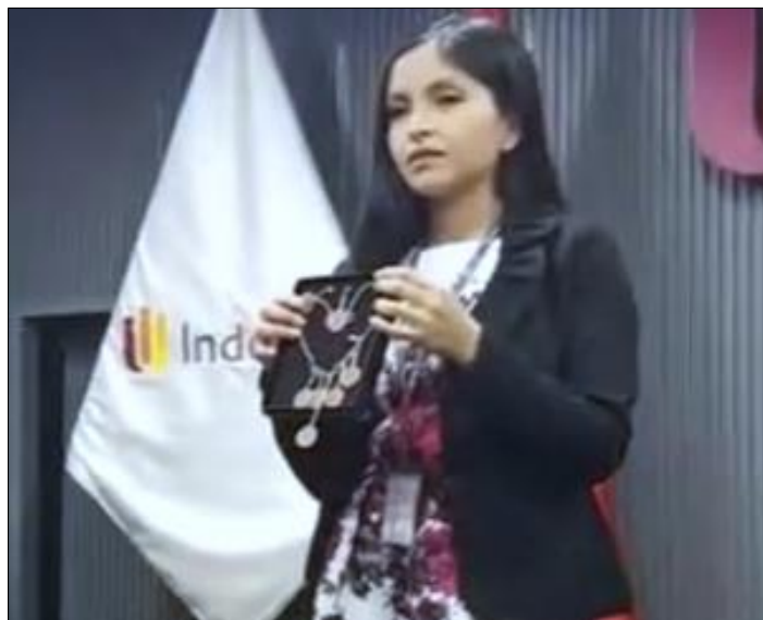
L'œuvre gagnante : accessoires "COYLLUR WALLA" (collier et boucles d'oreilles)