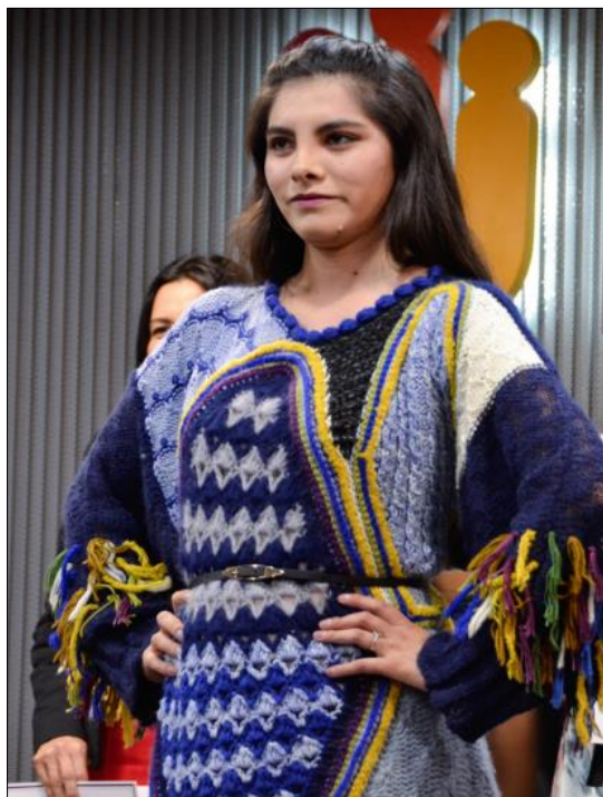
L'œuvre gagnante : robe "Larenas"