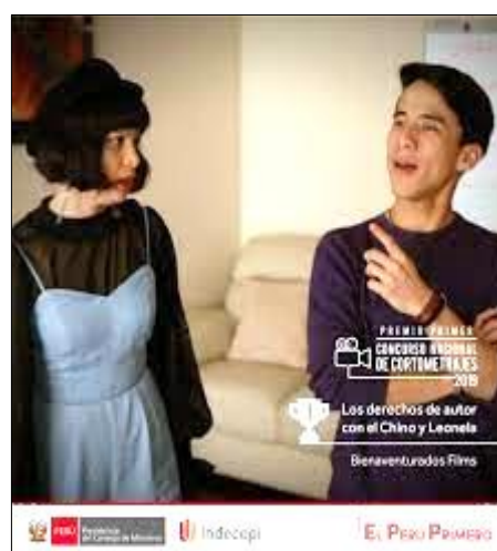
Le lauréat du concours de courts métrages : "Los derechos de autor con El Chino y Leonela"

29. Ce concours a été le premier de ceux organisés par le Département du droit d'auteur à recevoir l'appui symbolique du Ministère de la culture, qui se poursuit à ce jour.