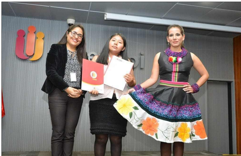
La troisième place : vêtement appelé GLOSBE, terme aymara signifiant “multicolore”

20. L'œuvre s'inspire de la LLIKLLA de Puña, la créatrice mettant l'accent sur la combinaison des couleurs et la forme de la LLIKLLA dans les coupes des différentes pièces grâce à l'utilisation du crochet et à la maîtrise des arts visuels dans le tissu peint. La lliklla est une étoffe tissée portée par les femmes des Andes péruviennes qui a de multiples usages. Elle est généralement très colorée, avec des motifs, des tailles et des couleurs qui varient en fonction de la région, de l'ethnie ou de la nationalité de l'artisan.