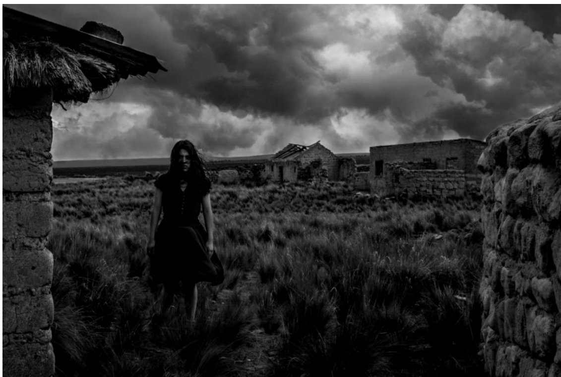
La photographie gagnante : "PARAISO PROHIBIDO"