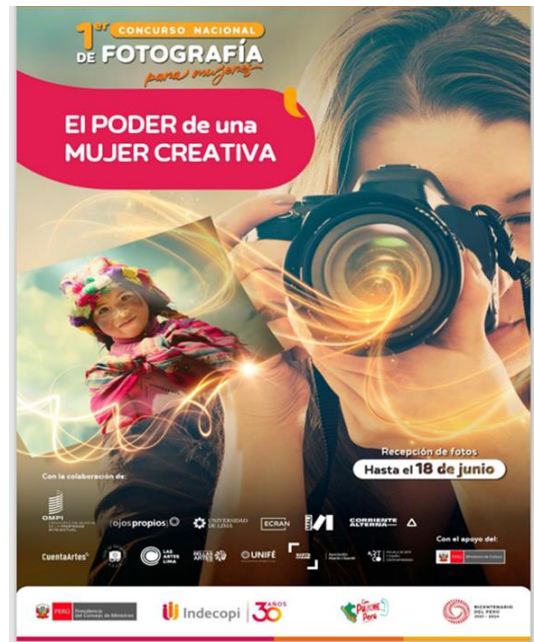
Affiches du concours