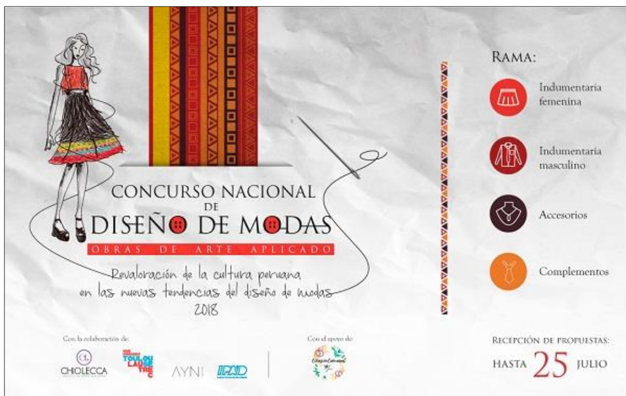
Affiche du concours

14. Le premier concours national, sur le stylisme avec des œuvres d'art appliqué, a été organisé en 2018 dans le but de sensibiliser à l'importance du droit d'auteur pour les œuvres d'art appliqué, entendues comme des œuvres d'art appliquées à des objets d'usage pratique. Il peut s'agir d'œuvres d'artisans ou d'œuvres produites à l'échelle industrielle, qui ont un lien avec le domaine du stylisme et qui comportent notamment des motifs reflétant notre identité culturelle.