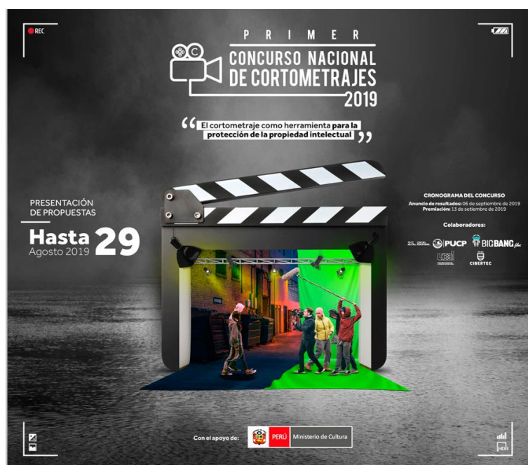
Affiche du concours

27. Lors de ce concours, l'accent a été mis sur l'importance d'initiatives similaires visant à stimuler la créativité et la production cinématographique péruvienne en valorisant la culture et en encourageant les propositions originales provenant de tout le pays, ainsi qu'en favorisant le respect du droit d'auteur et le rejet du piratage.