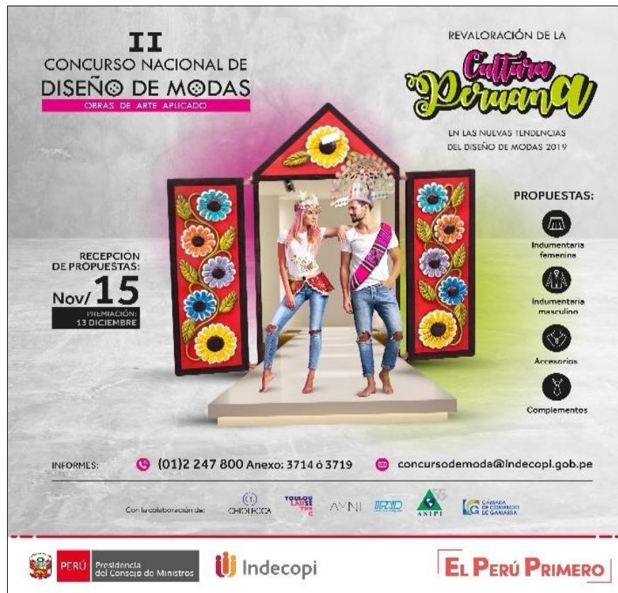
Affiche du concours

21. Devant le succès et l'engouement suscités par le premier concours sur le stylisme pour les œuvres d'art appliqué, le Département du droit d'auteur a organisé une deuxième édition du concours en 2019.