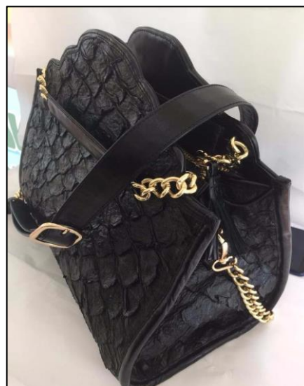
La deuxième place : accessoire (sac à main) "Selva Cautivante"