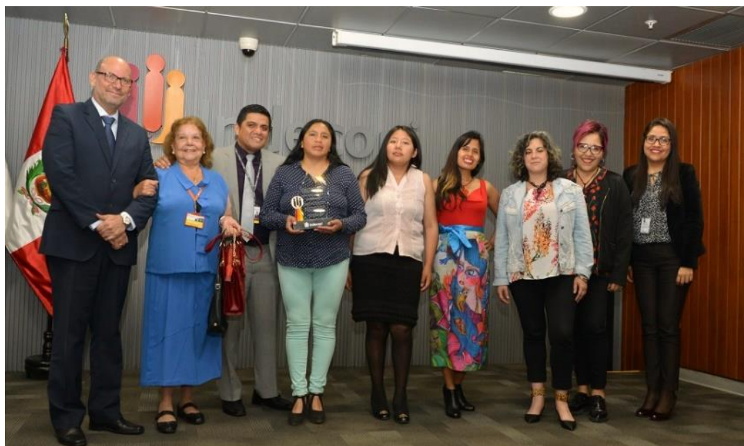
Les lauréates du concours posant avec le jury et le personnel du Département du droit d'auteur le jour de la cérémonie de remise des prix

20. L'œuvre s'inspire de la LLIKLLA de Puña, la créatrice mettant l'accent sur la combinaison des couleurs et la forme de la LLIKLLA dans les coupes des différentes pièces grâce à l'utilisation du crochet et à la maîtrise des arts visuels dans le tissu peint. La lliklla est une étoffe tissée portée par les femmes des Andes péruviennes qui a de multiples usages. Elle est généralement très colorée, avec des motifs, des tailles et des couleurs qui varient en fonction de la région, de l'ethnie ou de la nationalité de l'artisan.